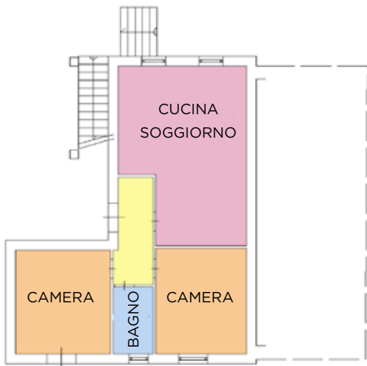
PIANO TERRA h. 2.75